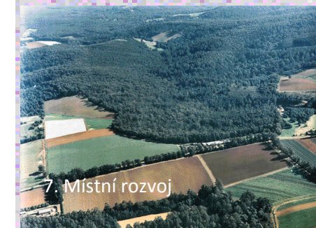
7. Místní rozvoj