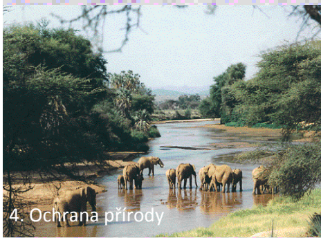
4. Ochrana přírody