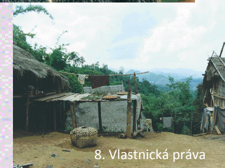
8. Vlastnická práva