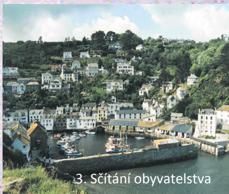
3. Sčítání obyvatelstva