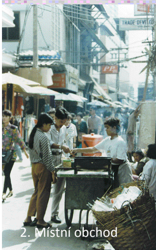
2. Místní obchod