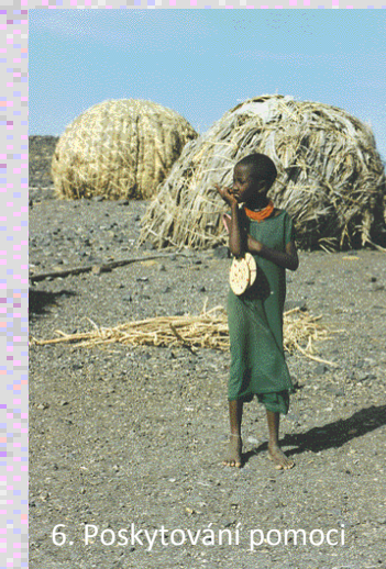
6. Poskytování pomoci