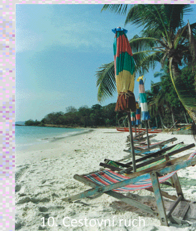
10. Cestovní ruch