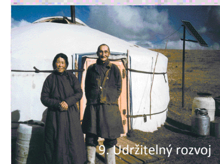
9. Udržitelný rozvoj