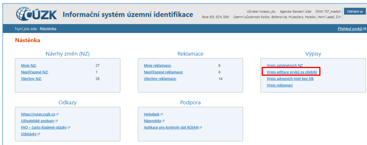
Obr. 1: Úvodní obrazovka ISÚI (Nástěnka)

V souvislosti s výkonem kontroly je možné si od kontrolované osoby vyžádat 1 např., „Výpis editace prvků za období“ (viz obr. 1). Výpis mohou editoři vygenerovat přímo v ISÚI pro libovolně definované časové období.