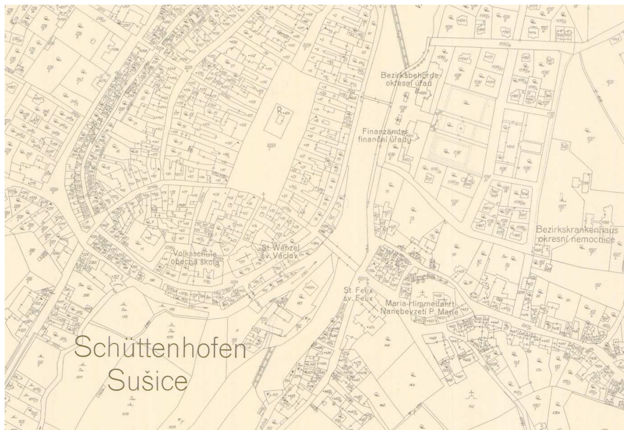
Obr. 3: Otisk katastrální mapy Sušice z roku 1941 (výřez)

výkazech ploch v pořadí již čtvrtým velkým archivním souborem stabilního katastru dostupným ke studiu dálkovým přístupem.