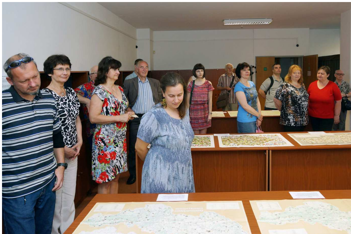
Obr. 1: Návštěvníci výstavy v ÚAZK

V průběhu roku se uskutečnilo v archivu celkem 8 exkurzí – studenti Přírodovědecké fakulty Univerzity Karlovy (2x), studenti archivnictví Univerzity Komenského v Bratislavě, studenti archivnictví Univerzity v Hradci Králové, studenti Střední průmyslové školy zeměměřické v Praze a Střední průmyslové školy stavební v Opavě, účastníci mezinárodního kongresu ISPRS a archiváři Státního okresního archivu Hradec Králové.