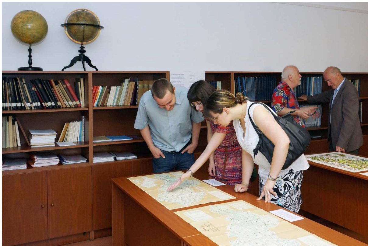
Obr. 2: Návštěvníci výstavy v ÚAZK