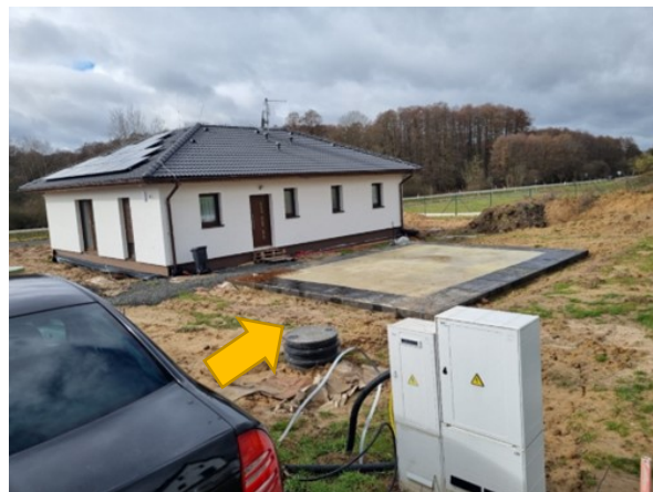
Obr. 2 - Situace s domem (st. 703 rod.dům a st. 704 – garáž) ze dne 19. 2. 2024