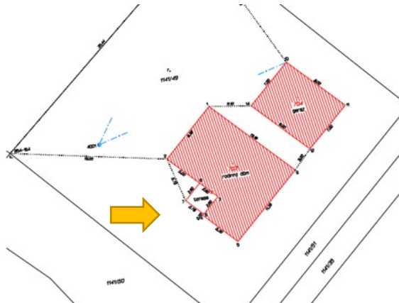
Obr. 3 – Výřez z náčrtu ZPMZ č. XXXX, ověřeno dne 22. 8. 2023