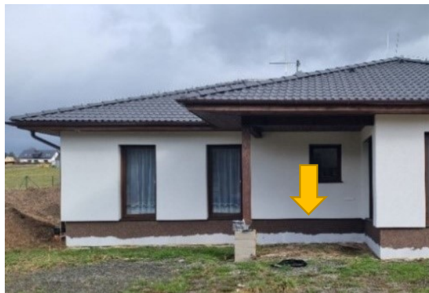
Obr. 4 - Terasa má být od pilíře vpravo k rohu domu (fotodokumentace ze dne 19. 2. 2024).

K vytýkaným vadám obviněný ve svém podání uvedl „Co se týká „terasy“ k rodinnému domu, myslím že do zastavěné plochy patří. Chyba je pouze v náčrtu, kde měl vyhotovitel místo slova „terasa“ napsat k dotčené ploše „zastřešeno“ a body 6, 7 a 8 v geometrickém plánu popsat podle skutečnosti „sloupek střechy“, „trám střechy“ apod.“